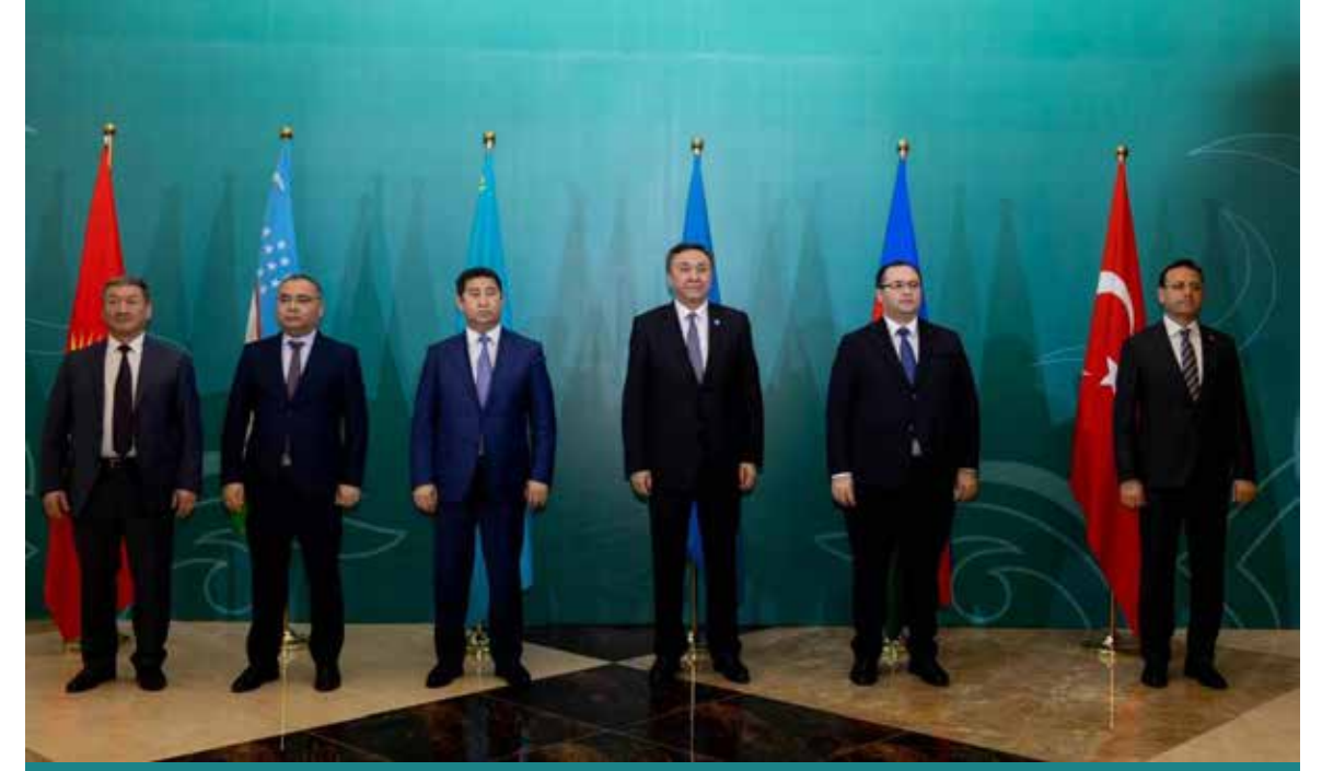
Kazakistan Tarım Bakanı Aydarbek Saparov (sol 3), Azerbaycan Tarım Bakanı Mecnun Memmedov (sağ 2), Özbekistan Tarım Bakanı İbrahim Abdurahmonov (sol 2), Kırgızistan Tarım Bakanı Birinci Yardımcısı Kubat Kaseyinov (solda), Türkiye Tarım ve Orman Bakan Yardımcısı Ebubekir Gizligider (sağda), TDT Genel Sekreteri Kubançıbek Ömüraliyev (sağ 3).

Yerel ve iklimle dayanıklı tarımsal ürün çeşitlerinin korunması ve yaygınlaştırılması için bölgesel bir tohum bankası oluşturulmasına yönelik çalışmaların sürdürülmesinin önemine değinildiği aktarılan bildiride, bunun yanı sıra TDT üyeleri arasında ortak dijital bir tarım veri platformunun oluşturulmasını hızlandırma konusunda mutabık kalındığı kaydedildi. Bildiride, Eylül 2024'ten itibaren bir yıllık dönem için Kazakistan'ın Taraz kentinin "TDT Tarım Başkenti" ilan edilmesi ve bir sonraki tarım bakanları toplantısının da Kırgızistan'ın Çolpan Ata kentinde düzenlenmesine karar verildiği ifade edildi.